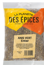
ANIS VERT - 100g Green Anise EAN code : 3102870045529