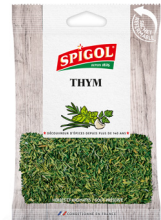
THYM - 30g Thyme EAN code : 3102870040586