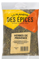
HERBES DE PROVENCE - 65g Provence's Herbs EAN code : 3102870075731