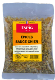
ÉPICES SAUCE CHIEN Chien Seasoning 100g - EAN code : 3102870060003