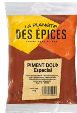
PIMENT DOUX ESPECIAL - 100g Especially Sweet Pepper Powder EAN code : 3102870045895