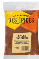
ÉPICES TANDOORI - 100g Tandoori Seasoning EAN code : 3102870046007