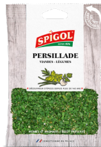
PERSILLADE - 50g Parsley EAN code : 3102870040845