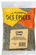
CUMIN ENTIER - 100g Cumin Seeds EAN code : 3102870071658