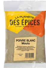
POIVRE BLANC MOULU - 100g Ground White Pepper EAN code : 3102870064414