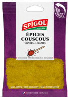
ÉPICES COUSCOUS - 90g Couscous Seasoning EAN code : 3102870040104