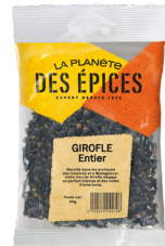
GIROFLE ENTIER - 50g Cloves EAN code : 3102870045796