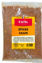
ÉPICES CAJUN Cajun Seasoning 100g - EAN code : 3102870012514 1kg - EAN code : 3102870012521