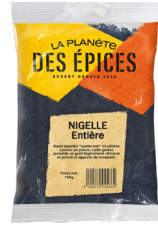
NIGELLE ENTÈRE - 100g Black cumin seeds EAN code : 3102870045864