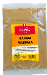
GARAM MASSALA Garam Massala Seasoning 100g - EAN code : 3102870021653 500g - EAN code : 3102870021615