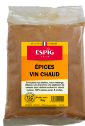
MÉLANGE VIN CHAUD Mulled Wine Seasoning 100g - EAN code : 3102870021394 1kg - EAN code : 3102870021448