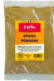
ÉPICES POISSON Fish Seasoning 100g - EAN code : 3102870000757 500g - EAN code : 3102870000764