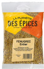
FENUGREC ENTIER - 100g Fenugreek Seeds EAN code : 3102870045765