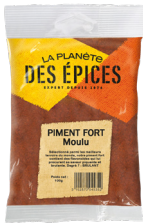
PIMENT FORT MOULU - 100g Ground Hot Chili Pepper EAN code : 3102870045352