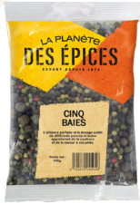
CINQ BAIES - 100g Five Berries EAN code : 3102870045956