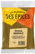
ÉPICES MASSALE - 100g Massale Seasoning EAN code : 3102870045826