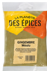
GINGEMBRE MOULU - 100g Ground Ginger EAN code : 3102870045789