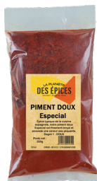
PIMENT DOUX ESPECIAL - 250g Espical Sweet Pepper Powder