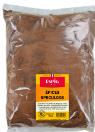
ÉPICES SPECULOOS Speculoos Seasoning 1kg - EAN code : 3102870071818