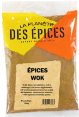
ÉPICES WOK - 100g Wok Seasoning EAN code : 3102870079524