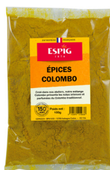
ÉPICES COLOMBO Colombo Seasoning 100g - EAN code : 3102870015638 250g - EAN code : 3102870015584 1kg - EAN code : 3102870015607