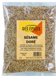
SÉSAME DORÉ - 250g Grilled Sesam