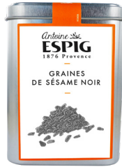
GRAINES DE SÉSAME NOIRES ENTIÈRES - 300g Black Sesam Seeds