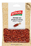
PIMENT PAILLETTE - 80g Hot Pepper Flakes