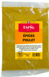
ÉPICES POULET Chicken Seasoning 100g - EAN code : 3102870026443 1kg - EAN code : 3102870026474