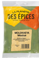
MOLOKHEYA MOULUE - 100g Ground Molokheya EAN code : 3102870045840