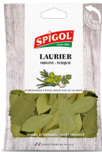
LAURIER - 10g Laurel EAN code : 3102870040548