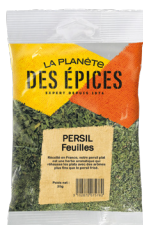
PERSIL FEUILLES - 20g Parsley Leaves EAN code : 3102870075762