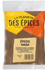
ÉPICES YASSA - 100g Yassa Seasoning EAN code : 3102870077643