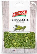
CIBOULETTE - 12g Chive EAN code : 3102870040838