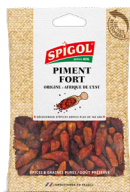
PIMENT FORT ENTIER - 30g Whole Hot Pepper