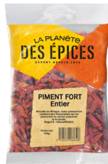
PIMENT FORT ENTIER - 100g Hot Chili Pepper EAN code : 3102870068696