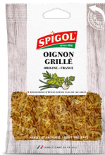
OIGNON GRILLÉ ENTIER - 50g Grilled and Sliced Onion EAN code : 3102870040975