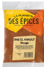
RAS EL HANOUT ROUGE - 100g Red Ras El Hanout EAN code : 3102870045369