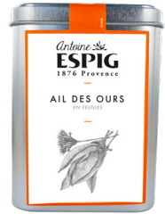
AIL DES OURS EN FEUILLES - 80g Wild Garlic Leaves