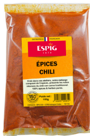
ÉPICES CHILI Chili Seasoning 100g - EAN code : 3102870022810 500g - EAN code : 3102870012521