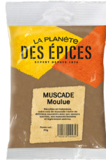
MUSCADE MOULUE - 50g Ground Nutmeg EAN code : 3102870045857