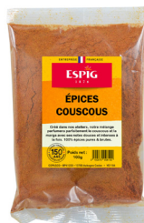
ÉPICES COUSCOUS Couscous Seasoning 100 - EAN code : 3102870006100 250g - EAN code : 3102870006063 1kg - EAN code : 3102870006087