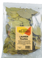
LAURIER FEUILLES - 20g Laurel Leaves EAN code : 3102870064438