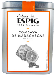
COMBAVA DE MADAGASCAR ENTIÈRES - 40g Madagascar Combava Zest