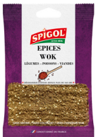
ÉPICES WOK - 80g Wok Seasoning EAN code : 3102870079548