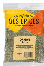
ORIGAN EXTRA - 35g Oregano Extra EAN code : 3102870075748