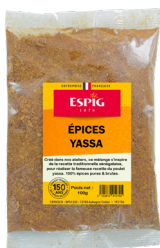
ÉPICES YASSA Yassa Seasoning 100g - EAN code : 3102870012705 1kg - EAN code : 3102870012712