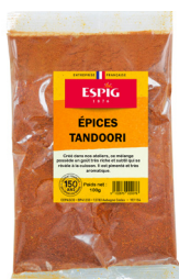
ÉPICES TANDOORI Tandoori Seasoning 100g - EAN code : 3102870020076 250g - EAN code : 3102870020038 1kg - EAN code : 3102870020052