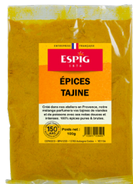
ÉPICES TAJINE Tajine Seasoning 100g - EAN code : 3102870026405 1kg - EAN code : 3102870026429