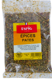
ÉPICES PÂTES Pasta Seasoning 50g - EAN code : 3102870041569 1kg - EAN code : 3102870041583