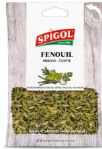
FENOUIL - 60g Fennel Seeds EAN code : 3102870040524