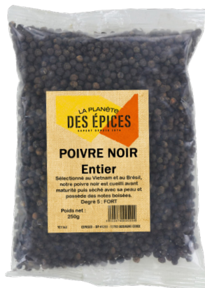
POIVRE NOIR ENTIER - 250g Whole Black Pepper