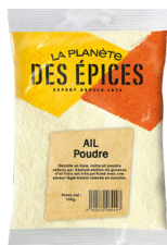
AIL POUDRE - 100g Garlic Powder EAN code : 3102870064407