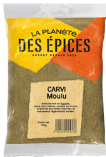
CARVI MOULU - 100g Ground Caraway EAN code : 3102870045338