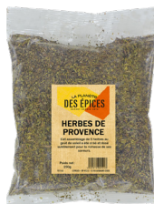
HERBES DE PROVENCE - 250g Provence's Herbs EAN code : 3102870045413