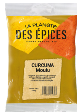
CURCUMA MOULU - 100g Ground Turmeric EAN code : 3102870045697