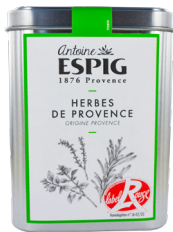
HERBES DE PROVENCE LABEL ROUGE - 130g Provence Herbs «Red Label»