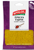
ÉPICES TAJINE - 80g Tajine Seasoning EAN code : 3102870040180