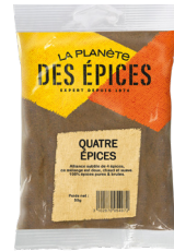
QUATRE ÉPICES - 50g Four Spices Seasoning EAN code : 3102870054972