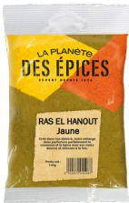
RAS EL HANOUT JAUNE - 100g Yellow Ras El Hanout EAN code : 3102870045987