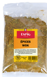
ÉPICES WOK Wok Seasoning 100g - EAN code : 3102870026405 1kg - EAN code : 3102870026429