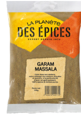
GARAM MASSALA - 100g Garam Massala Seasoning EAN code : 3102870045772