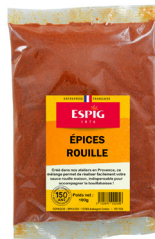
ÉPICES ROUILLE (SOUPE DE POISSON) Rouille (Fish Soup) Seasoning 100g - EAN code : 3102870022056 1kg - EAN code : 3102870022063