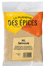
AIL SEMOULE - 100g Granulated Garlic EAN code : 3102870045512