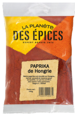
PAPRIKA DE HONGRIE - 100g Hungarian Paprika EAN code : 3102870045871