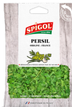
PERSIL - 20g Parsley EAN code : 3102870040562