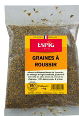
GRAINES À ROUSSIR Seeds Mix 100g - EAN code : 3102870008579 1kg - EAN code : 3102870008586