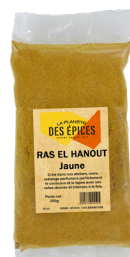
RAS EL HANOUT JAUNE - 250g Yellow Ras El Hanout