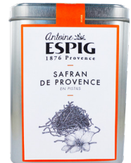
SAFRAN DE PROVENCE EN PISTILS - 5g Provence Saffron Pistils