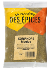
CORIANDRE MOULUE - 100g Ground Coriander EAN code : 3102870045659