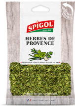
HERBES DE PROVENCE - 40g Provence's Herbs EAN code : 3102870040531