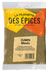
CUMIN MOULU - 100g Ground Cumin EAN code : 3102870045680