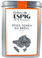
FÈVES TONKA DU BRÉSIL ENTIÈRES - 200g Whole Brazil Tonka Beans