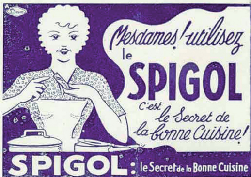
Publicité trouvée dans un programme de spectacle de 1930.