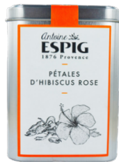
PÉTALES D'HIBISCUS ROSE - 70g