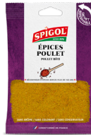
ÉPICES POULET - 90g Chicken Seasoning EAN code : 3102870040111