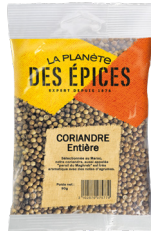
CORIANDRE ENTIÈRE - 90g Coriander Seeds EAN code : 3102870075779