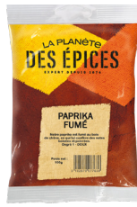
PAPRIKA FUMÉ - 100g Smoked Paprika EAN code : 3102870077636