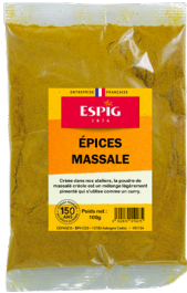
ÉPICES MASSALÉ Massale Seasoning 100g - EAN code : 3102870010275 500g - EAN code : 3102870010237