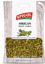
ORIGAN - 25g Oregano EAN code : 3102870040821